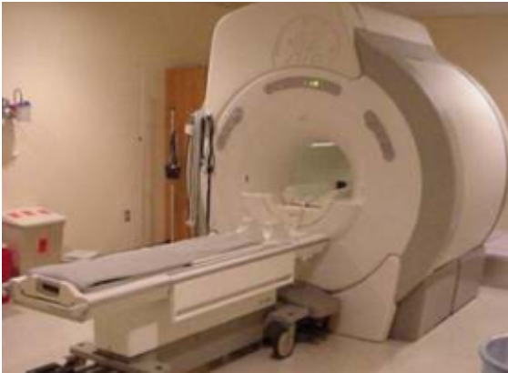
Korszerű MR készülék

A saját ruhát le kell cserélni egy kórházi köpenyre és el kell helyezkedni a vizsgálóasztalon. A beteget ezután becsúsztatják az alagútszerű készülékbe. A vizsgálat alatt senki nem tartózkodik a helyiségben, de lehetséges kommunikálni a személyzettel mikrofonon keresztül. Általában van egy csengőgomb is, amivel a beteg jelezheti, ha már elviselhetetlen számára a bezártság érzés, vagy rosszul van. Légbefúvóval keringetik a levegőt az alagút belsejében.